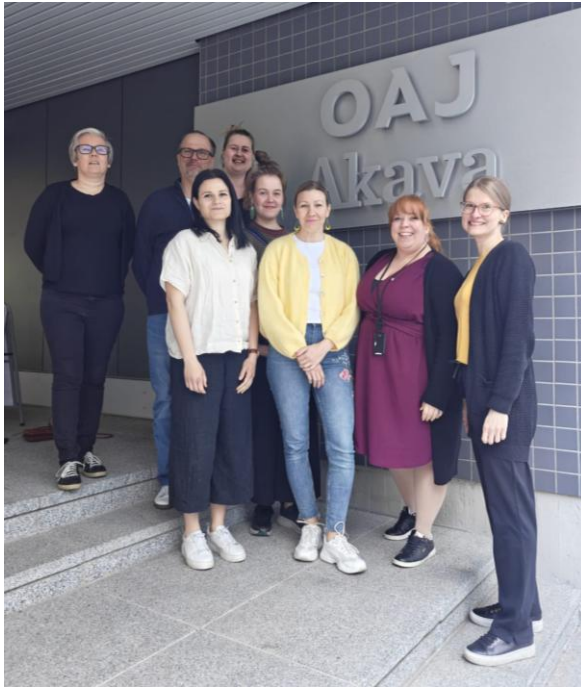
EKOAY:n ja VOAY:n edustus